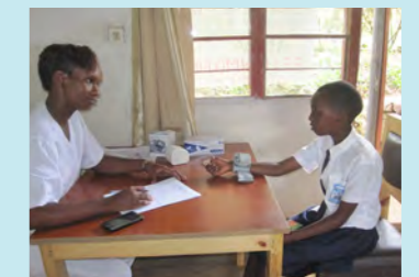
健康診断の様子