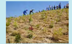
植樹の様子

第41回目の森づくりは、宮城県岩沼市下野郷浜(千年希望の丘)に、シイ、タブ、カンなど5,400本を植樹しました。(助成団体:瓦礫を活かす森の長城プロジェクト)