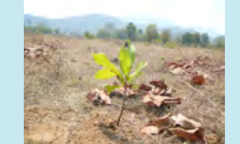
新たに植樹したカシューの苗木

第11回の海外での森づくりとして、インド、西ベンガル州にマングローブ、オディッシャ州にカシューの木、ジャルカント州にたくさんの種類の樹木の植樹を進めています。(助成団体:タゴール協会)