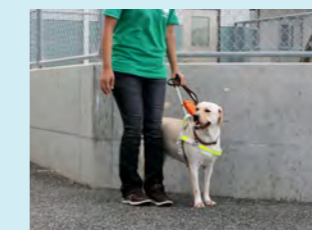
訓練を受ける盲導犬

「東日本大震災フェリシモメリーしあわせ基金」では、東日本大震災で被災された方々が笑顔になれる「笑顔の森 ふれあいコンサート（郡山、相馬）」へ拠出しました。