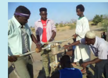
住民の手による補修

バングラデシュ人民共和国 バングラデシュ・地域ぐるみの障害者自立支援事業 (助成団体:シャプラニール=市民による海外協力の会)