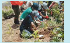
植樹の様子

第11回の海外での森づくりとして、インド、西ベンガル州にマングローブ、オディッシャ州にカシューの木、ジャルカント州にたくさんの種類の樹木の植樹を進めています。(助成団体:タゴール協会)