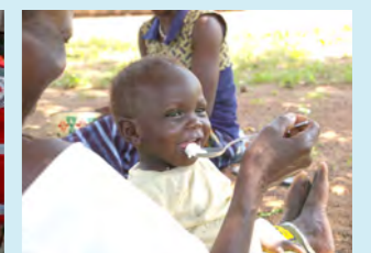
お粥を食べる子ども