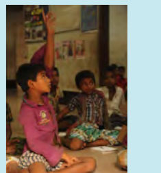
ドローピングセンターの子どもたち