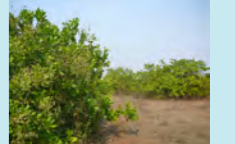
生長したカシューの木