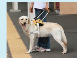
訓練を受ける盲導犬

「国内医療支援」では、日本骨髄バンクに寄付しました。白血病などの血液難病に苦しむ患者を救うため、その活動を広く社会に普及する事業に活用されます。