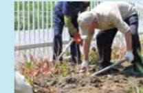
球根の堀上げの様子