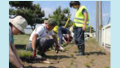
シバザクラの植栽の様子

子どもを持つプランナーmama.fの「世界中すべての子どもたちが健康で、楽しい毎日が過ごせるように」という思いから、基金付き商品販売しています。