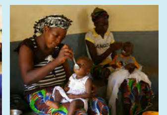
お粥を食べる子どもたち