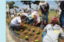
マリーゴールドの植栽の様子