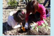
植樹の様子

第37回目の森づくりの3年目として、神奈川県横須賀市の湘南国際村めぐりの森に、シイ、タブ、カシなど1,000本を植樹しました。 (助成団体：協働参加型めぐりの森づくり推進会議)