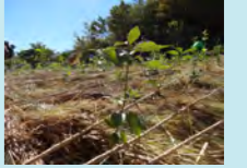
植樹の様子

第39回目の森づくりは、長野県の鬼無里奥裾花自然園にブナ、モミジ、ハウチワカエデなど1,500本を植樹しました。 (助成団体：鬼無里ブナの森を育てる会)