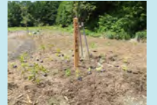
植樹前の様子

第39回目の森づくりは、長野県の鬼無里奥裾花自然園にブナ、モミジ、ハウチワカエデなど1,500本を植樹しました。 (助成団体：鬼無里ブナの森を育てる会)