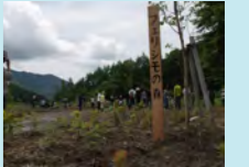
植樹後の様子

第40回目の森づくりは、タジキスタン共和国 ラシットヴァレー地域の給食プログラムを実施している学校に、アプリコット、りんご、ポプラなど30,000本を植樹しました。 (助成団体：国際連合世界食料計画WFP協会)