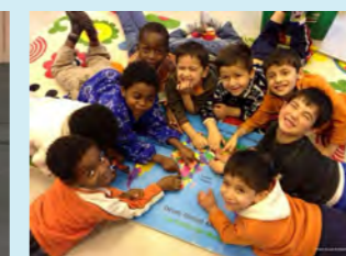
平和村施設の子どもたち